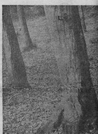
Grupă comună. (foto stînga); Un martor: Tudor, fost pădurar, actualmente pensionar. Alături: fagul însemnat cu crucea aminteste și azi asosul (foto mijloc); Semn în cruceat pe un arbore, în grupă cu cel împușcat, din Dealul Băicului Neamț (foto sus).